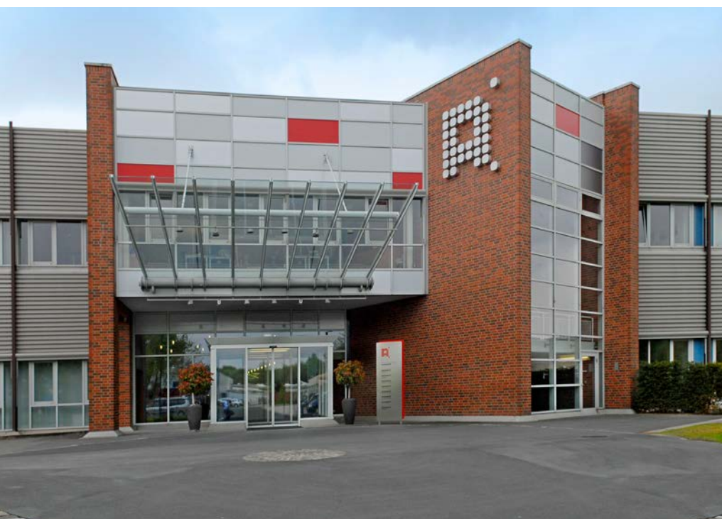
Aschendorff Druckzentrum GmbH & Co. KG, Münster, Deutschland