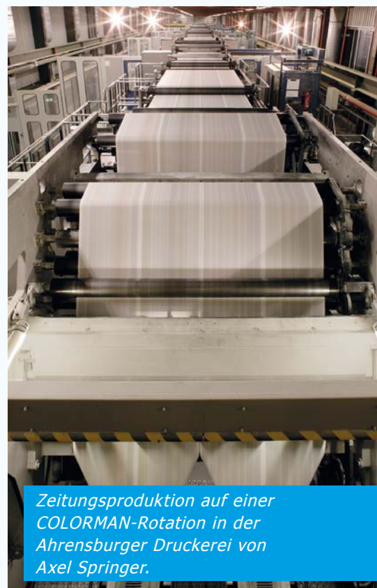
Zeitungsproduktion auf einer COLORMAN-Rotation in der Ahrensburger Druckerei von Axel Springer.