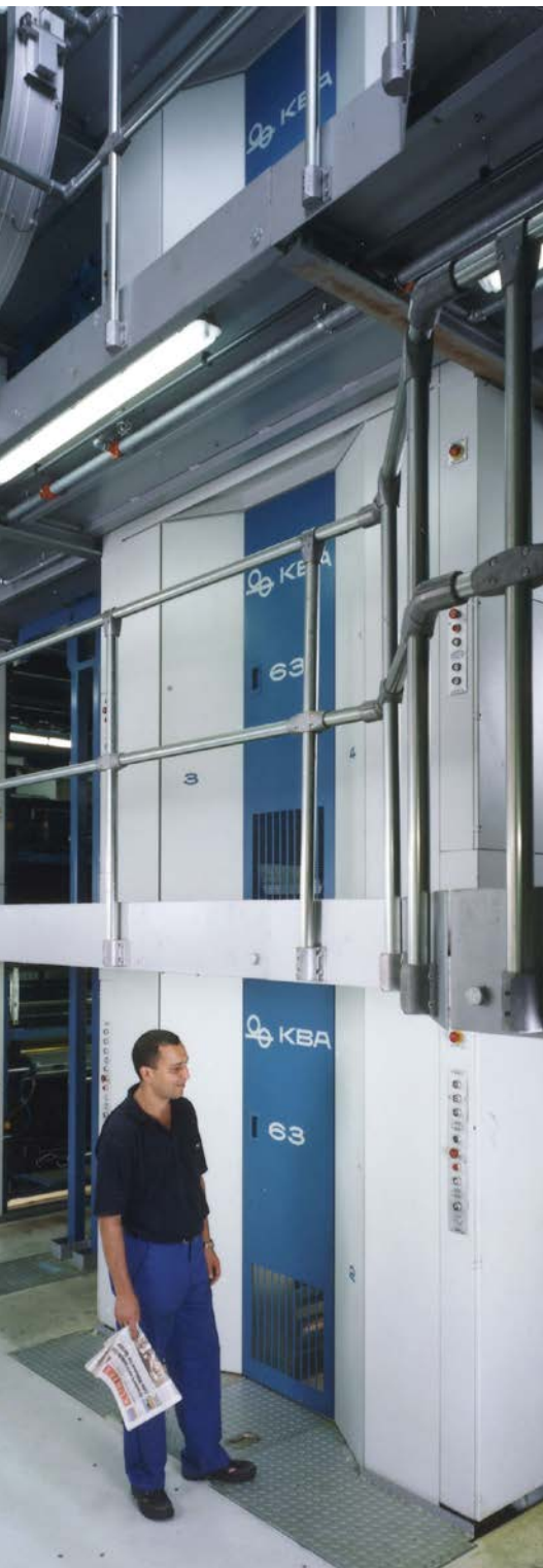
Mediaprint produziert auf insgesamt 13 KBA Commander-Rotationen, die in einem umfangreichen Retrofit-Programm modernisiert werden.

Rotationen über die neuen Desk 7-Leitstände steuern wird. Die Pilotinstallation in allen drei Mediaprint-Druckereien wird insgesamt 26 Einheiten des neuen Leitstandstyps umfassen.