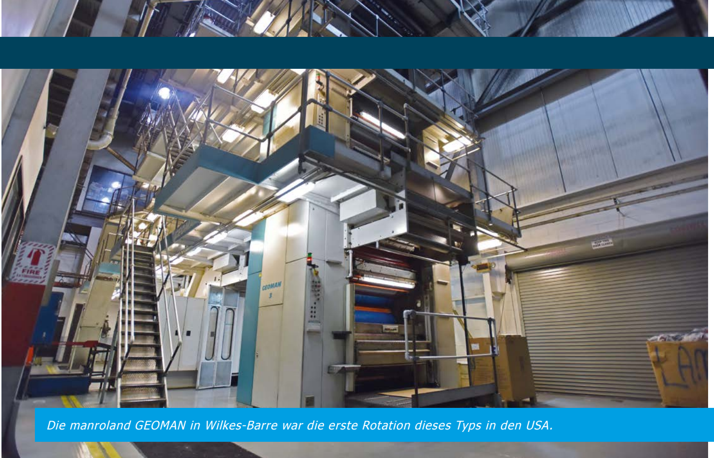
Die manroland GEOMAN in Wilkes-Barre war die erste Rotation dieses Typs in den USA.

Zudem wird an einem der drei Drucktürme das Interbus-Netzwerk (Verkabelung und Hardware-Baugruppen) erneuert.