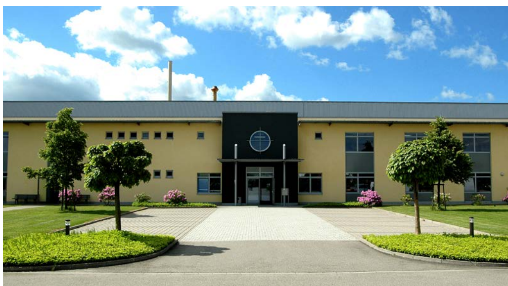
B&K Offsetdruck Ottersweier, Deutschland

Die neue Druckmaschine wird mit einem mRC-3D-System für das Farbregister, einem mRC-3D-System für das Schnittregister und einem IDS-3D-System für die Farbregelung ausgerüstet. Darüber hinaus wird die Maschine mit IQM ausgestattet, dem Managementinformationssystem von QIPC, mit welchem die Qualität des Druckerzeugnisses kalibriert wird, indem die Metadaten der Automatisierungssysteme ausgewertet