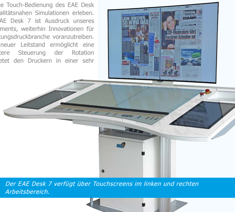
Der EAE Desk 7 verfügt über Touchscreens im linken und rechten Arbeitsbereich.