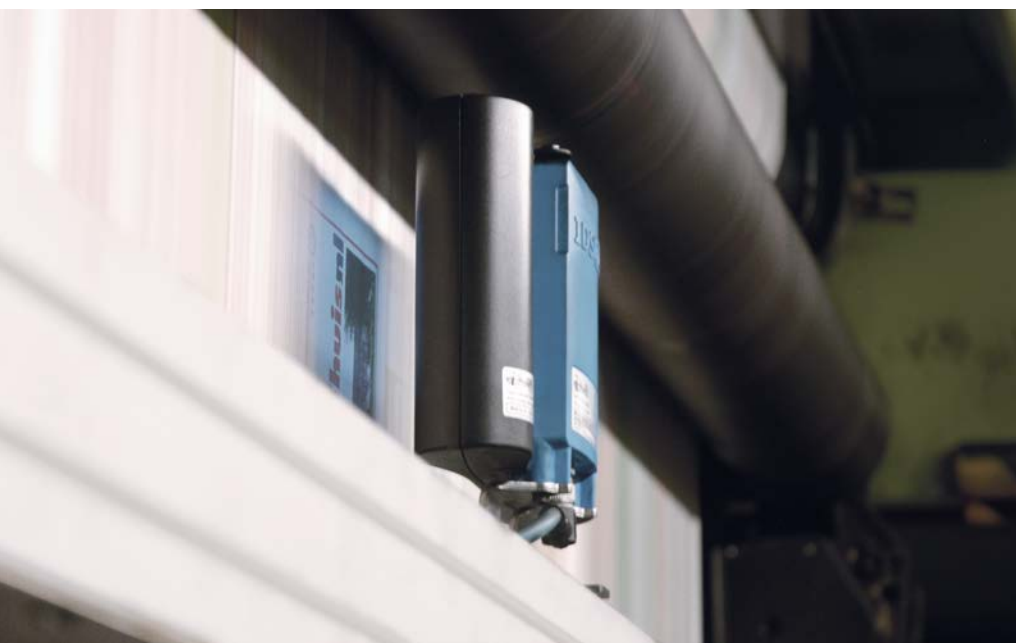
IDS-3D im Einsatz auf der manroland TELEMAN Druckmaschine bei TMG in Amsterdam.