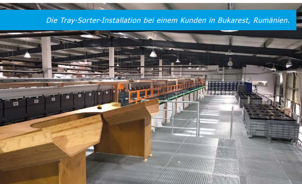
Die Tray-Sorter-Installation bei einem Kunden in Bukarest, Rumänien.

Projektrisiken zu minimieren, werden dabei das Anlagenlayout und der Kunden-Workflow definiert. Nach Auftragseingang erfolgen dann Anlagenplanung, Materialbeschaffung, Schaltschrankbau, Softwareentwicklung, Integrationstests, Installation und Inbetriebnahme.“ Doch auch nach dem Abschluss eines Projekts bleibt eine installierte Lösung im Fokus von EAE. Zur Absicherung der Anlagenverfügbarkeit steht den Kunden eine 24/7-Hotline für Telefon- und Remote-Support zur Verfügung.